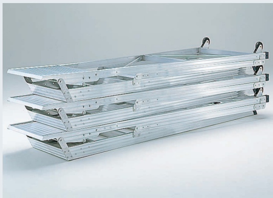
収納状態 フラットになるので収納スペースをムダにしません。 しかも、積み重ねて保管できるので何台あっても保管場所に困りません。