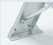
アンカー用穴(φ12)付き ※使用するときには必ずアンカーボルト等で固定してください