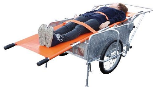
担架を乗せた状態

この度は弊社災害用リヤカーSMC-BSTシリーズをご購入頂き誠に有難う御座います。 災害用リヤカーを安全にご使用して頂く為に、この取扱説明書を良くお読みの上でご使用ください。